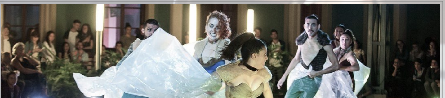
Foto: UNA DANZA JOVEN

Engolosinándome con el sentimiento masturbatorio de la cualidad única de mi expresión rítmica.